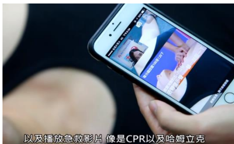
以及播放急救影片 像是CPR以及哈姆立克